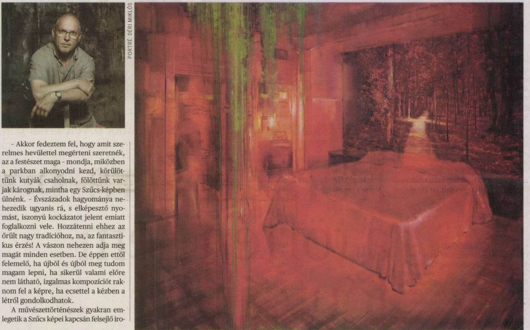
Vörös szoba, 2015, olaj, vászon, 200x240 cm

Szűcs biztos kezű mágikus realista, a feszültségteremtés higgadt mestere. Felkészült illuzionista, aki fátylakkal és függönyökkel bizonytalanít el bennünket. És kíváncsi detektív is: karkai képtelenségnek tetsző képei játékos vizsgálódásra hívnak minket mindenkor. Folyvást a formavilággal viaskodik, az anyagot provokálja, lendületes kompozícióit nemritkán tévutak, megtorpanások építik. Az élet festői leképezése foglal